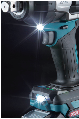
Luz de trabajo LED dual.